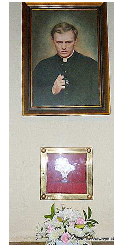
Obraz beatyfikacyjny Jerzego Popiełuszki Nagrobek księdza Jerzego Popiełuszki na terenie kościoła św. Stanisława Kostki w Warszawie Relikwie bł. Ks. Jerzego